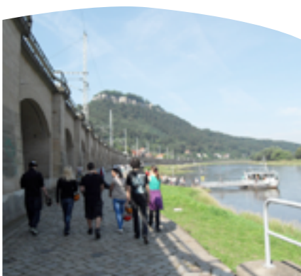
Konzeption JWG Die Lychener

→ Weiterführende Informationen siehe Anlage „Wattenbeker Qualitätsoffensive (WQ)“: