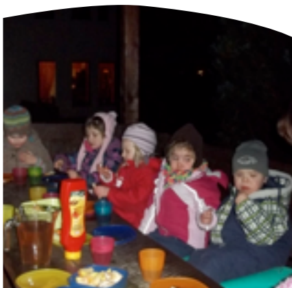
Konzeption Die Kleinen Siedler

→ Weiterführende Informationen siehe Anlage „Wattenbeker Qualitätsoffensive (WQ)“.