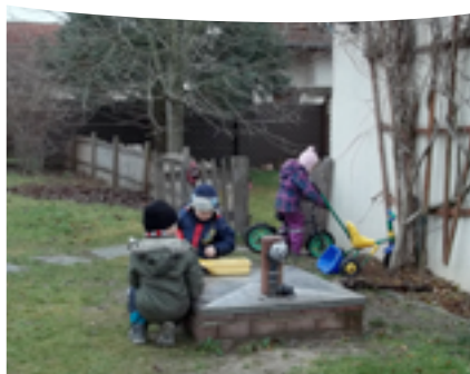
Stand Juli 2017