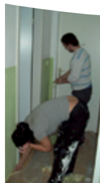
Stand März 2018