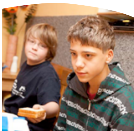
Konzeption Die Siedler

→ Weiterführende Informationen siehe Anlage „Wattenbeker Qualitätsoffensive (WQ)“.