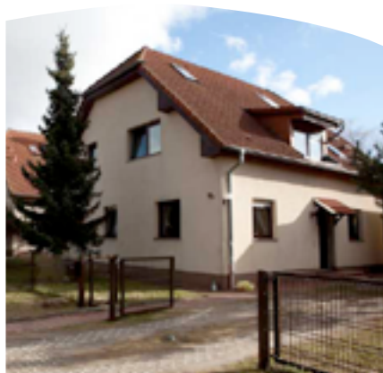
Konzeption Die Siedler