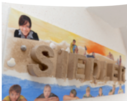
Stand April 2017