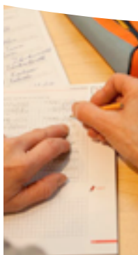
Stand April 2017