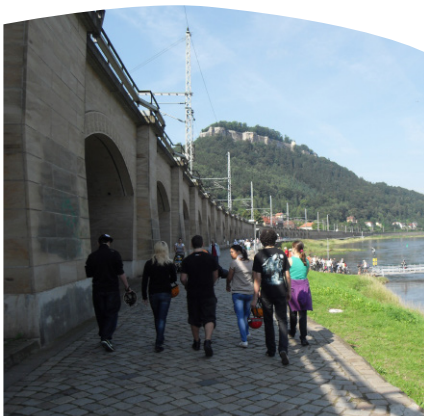
Konzeption Jugendwohngruppe Die Fichten

→ Weiterführende Informationen: siehe Anlage „Gewaltschutzkonzept“