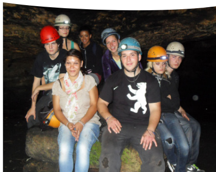
Stand November 2022