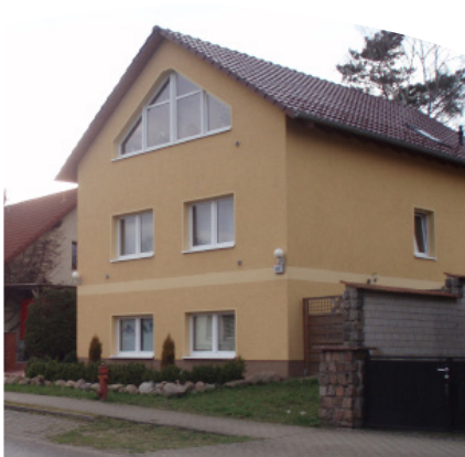
Konzeption Jugendwohngruppe Die Fichten